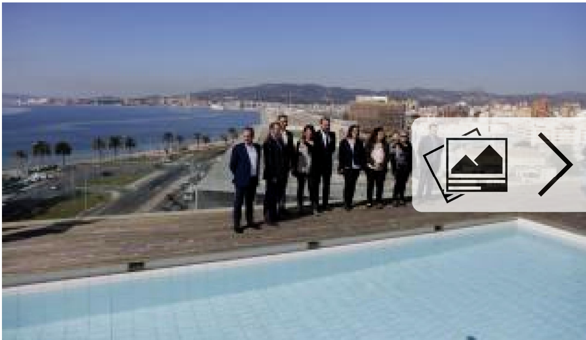
Fotogalerie: Countdown für Eröffnung von Palmas Kongresspalast